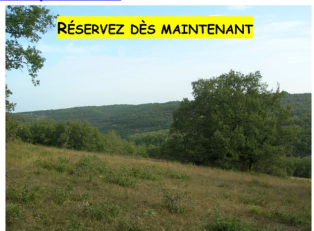
Parcours testé le 29 août