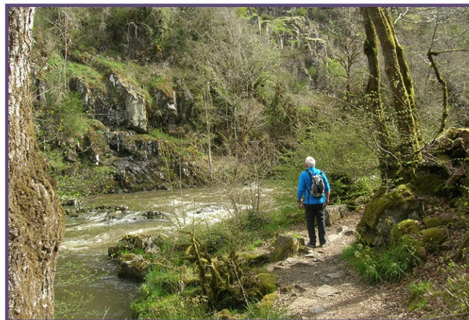
Parcours testé le 11 avril 2022